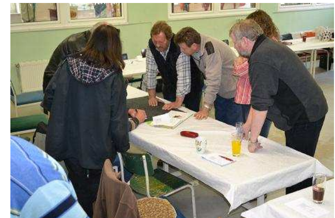
Mai und August/September Landesverbandsschulung in Itzehoe auf dem „Ehlershof“.