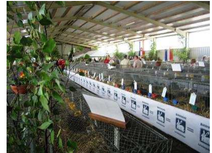
Juli / August - Jungtierschau- 25920 Risum-Lindholm